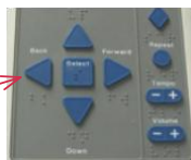
점자식 키패드를 이용하여